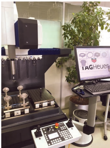
De plus en plus de secteurs d'activité (ici, la haute horlogerie) cherchent désormais à former leurs équipes à la mesure tridimensionnelle.

Depuis décembre dernier, les membres du Coffmet ont d'ailleurs constaté une hausse du nombre de stagiaires venant de leur propre chef pour concrétiser un changement d'orientation professionnelle. Si certains ont autofinancé leur formation par le biais