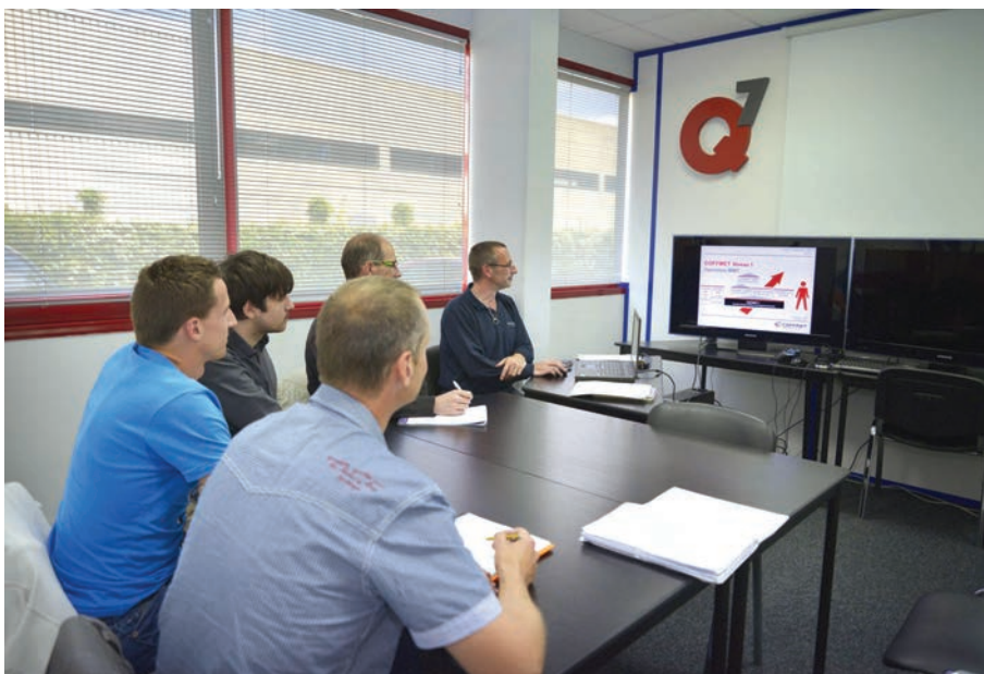
Proposer une formation Coffmet : un vecteur décisif de progression des collaborateurs comme de l'entreprise.

Signe qu'il convient de ne pas sous-estimer : les acteurs du Coffmet constatent parallèlement que les structures de formation initiale (lycées,