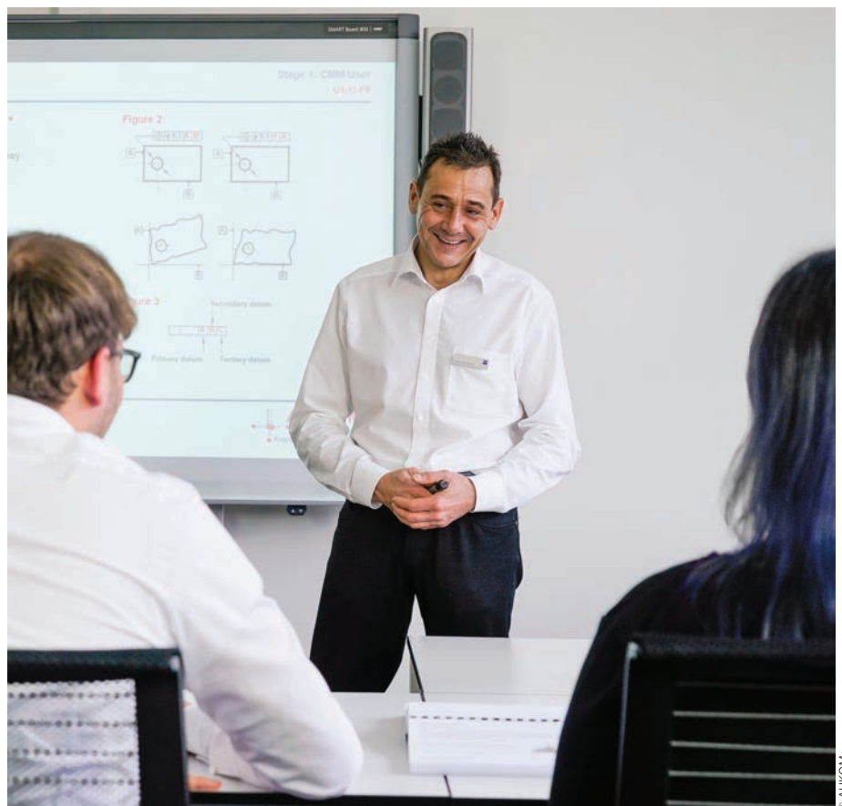
Faciliter l'acquisition par les collaborateurs de compétences stratégiques pour demain : des dispositifs d'accompagnement existent.

Jean Castex le réaffirmait fin septembre 2021 en présentant le « Plan de réduction des tensions de recrutement »: l'État veut continuer à investir dans les compétences aux côtés des entreprises pour les aider à s'adapter aux « transitions numériques et écologiques à l'œuvre » et à « former leurs salariés aux nouvelles techniques de production ». Depuis 2020, avec le Covid, 440 000 salariés en activité partielle ont bénéficié de formations dans le cadre du FNE (Fonds National de l'Emploi). Le financement de 50 000 formations